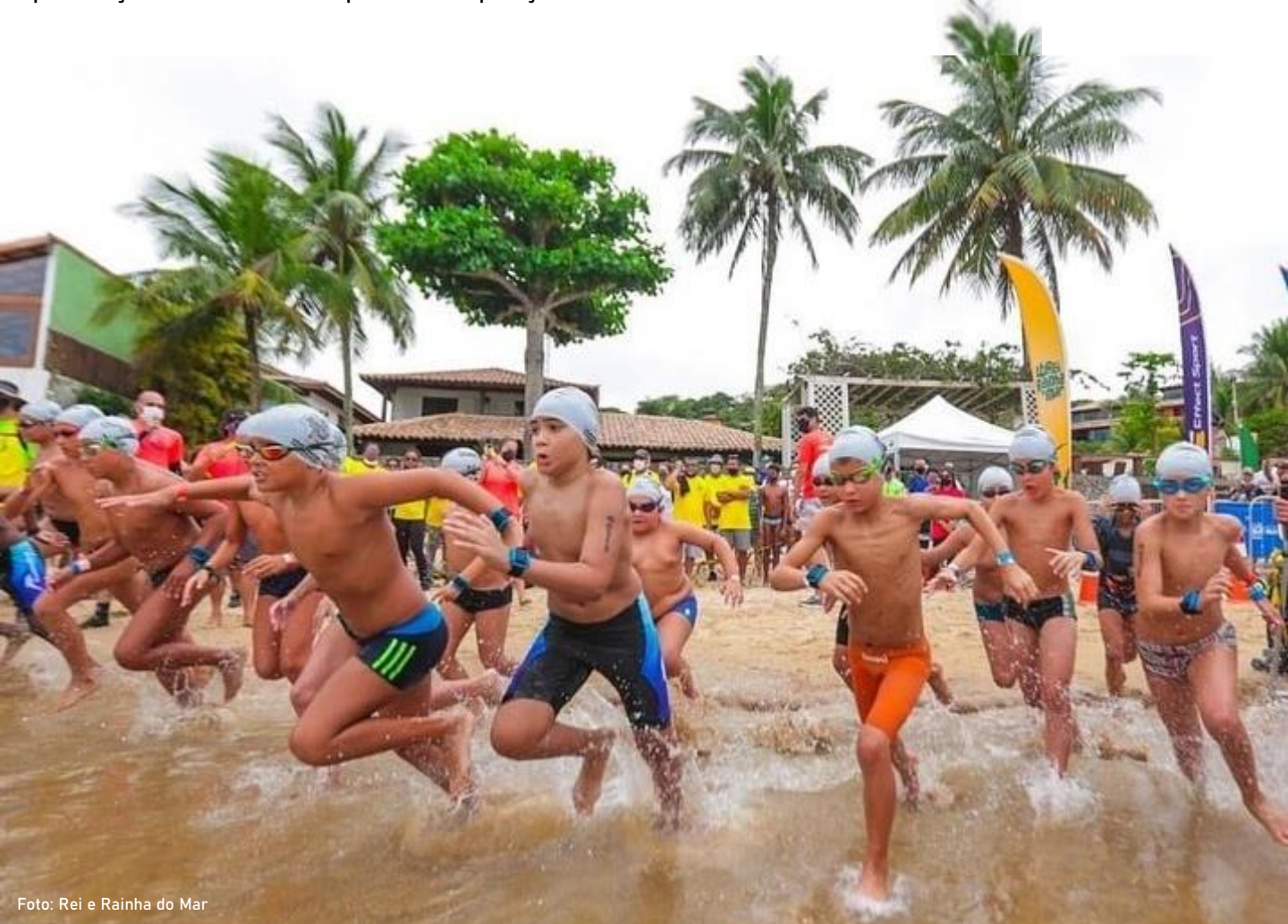
Foto: Rei e Rainha do Mar

O mês de novembro ficou marcado com o retorno do Rei e Rainha do Mar Búzios, o evento mais esperado pelos alunos do Golfinhos da Baixada. Esta etapa foi bastante desafiadora devido aos protocolos de segurança contra o COVID-19, pois diferente de outras etapas passadas, foi necessário uma série de documentações e autorizações para participação do atleta no evento, tanto pelos responsáveis quanto para acesso a cidade de Búzios. E como de costume os Golfinhos marcaram presença e tiveram destaque na competição com seus mais de 30 atletas da Baixada Fluminense.